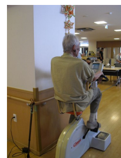
エアロバイクです。 有酸素運動で、 *生活習慣病の予防 *脳機能低下の予防 *肥満の改善 に効果があります