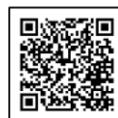
てとと公式ライン