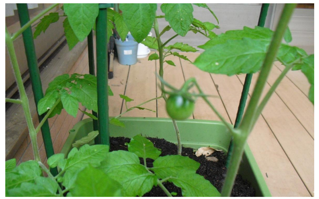
トマトの実がなりました